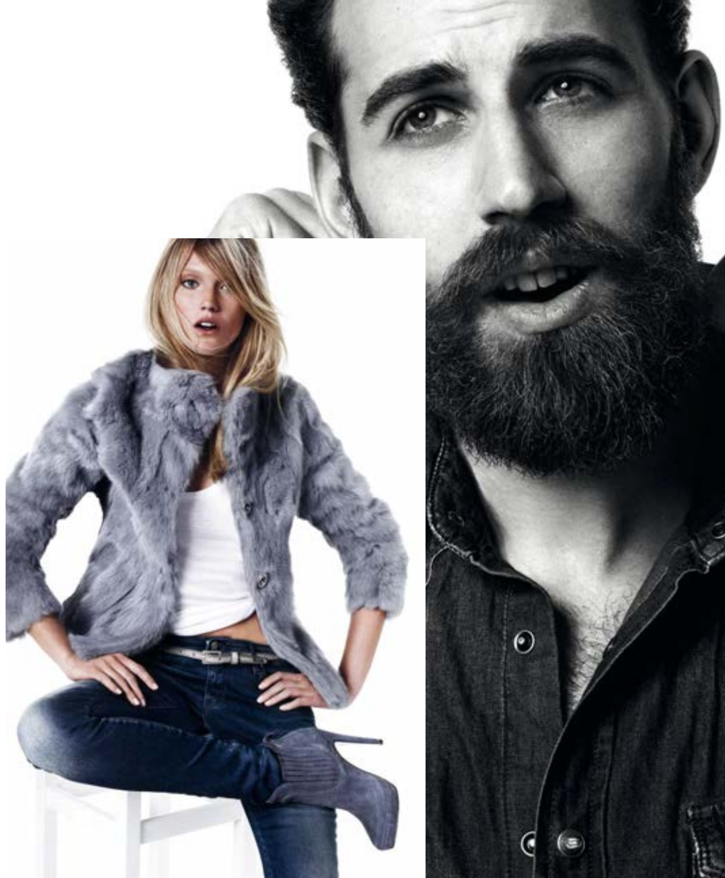
Jacket Delizia M/L Pants Sheyla W642 www.gasjeans.cz