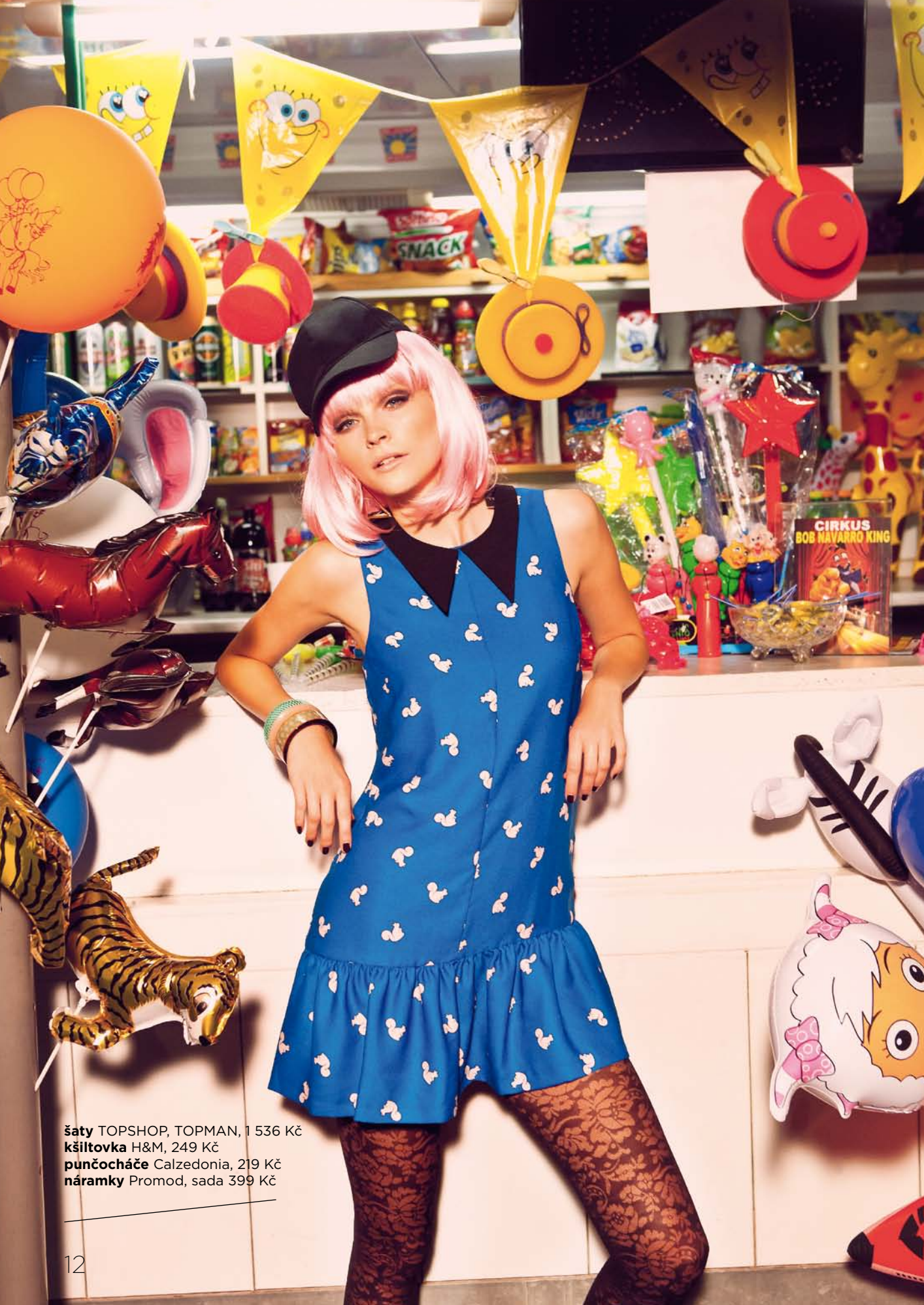
šaty TOPSHOP, TOPMAN, 1 536 Kč kšiltovka H&M, 249 Kč punčocháče Calzedonia, 219 Kč náramky Promod, sada 399 Kč